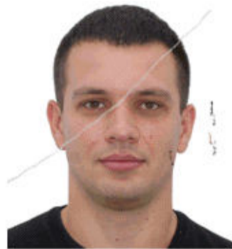
Зі слідами чорнила, зламами