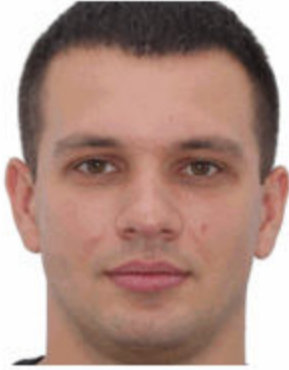
Кадрування більше ніж 80 %