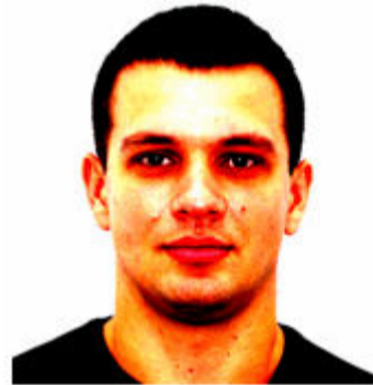
Неприродний колір шкіри та/ або відблиск на обличчі