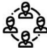
стосунки, що виникають у зв'язку з членством або діяльністю в громадських, політичних, релігійних чи інших організаціях

При вирішенні питання щодо наявності приватного інтересу в сфері службових повноважень як складової конфлікту інтересів слід у кожному випадку враховувати конкретні обставини, відносини та зв'язки особи, обсяг її службових/представницьких повноважень під час прийняття того чи іншого рішення.