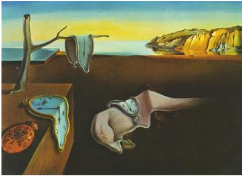
Картина Сальвадора Далі «Постійність пам'яті» до сонета Андрія Мітовського (зображення взято з інтернету)