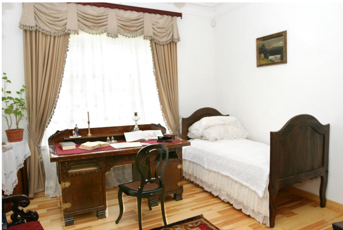
Кімната в будинку Андрія Козачковського в Переяславі, де Тарас Шевченко написав славнозвісний «Заповіт» 1845 року