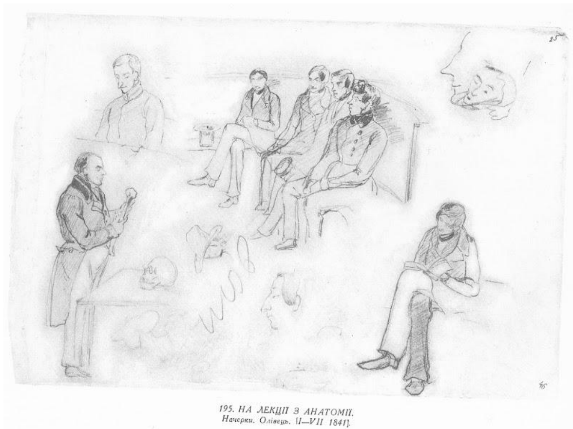
195. НА ЛЕКЦІЇ З АНАТОМІЇ. Начерки. Олівець. II—VII 1841.

Його Анатомо-хірургічні таблиці стали першою у світі працею, яка містила детальні малюнки органів у натуральну величину з проєкціями для операцій. Таблиці принесли йому світову славу та були перекладені багатьма мовами.