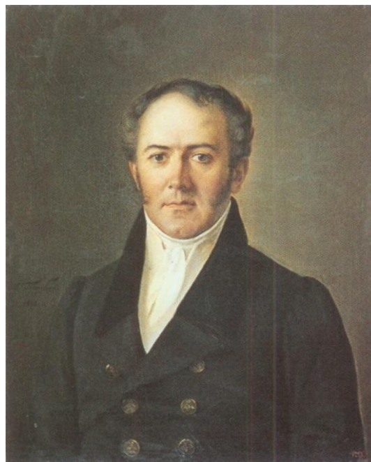
Ілля Буяльський

Навчаючись в Петербурзькій академії мистецтв, Тарас Шевченко 10 січня 1841 року був зарахований до списку учнів, яким дозволялося слухати анатомічний курс професора анатомії Петербурзької медико-хірургічної академії Іллі Васильовича Буяльського (1789–1866). Ці заняття були необхідні студентам Художньої академії, аби чітко змальовувати тілесну структуру людей. Із величезним зацікавленням майбутній поет слухав лекції Іллі Васильовича з пластичної хірургії. До речі, Шевченко був добрим слухачем, бо в